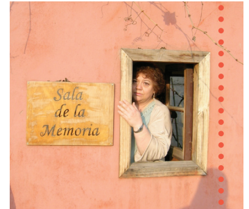
Parque por la Paz Villa Grimaldi, Chile