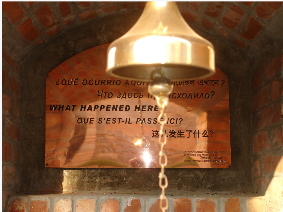
Plakat pada lokasi pembunuhan di Bangladesh yang didukung oleh Liberation War Museum.