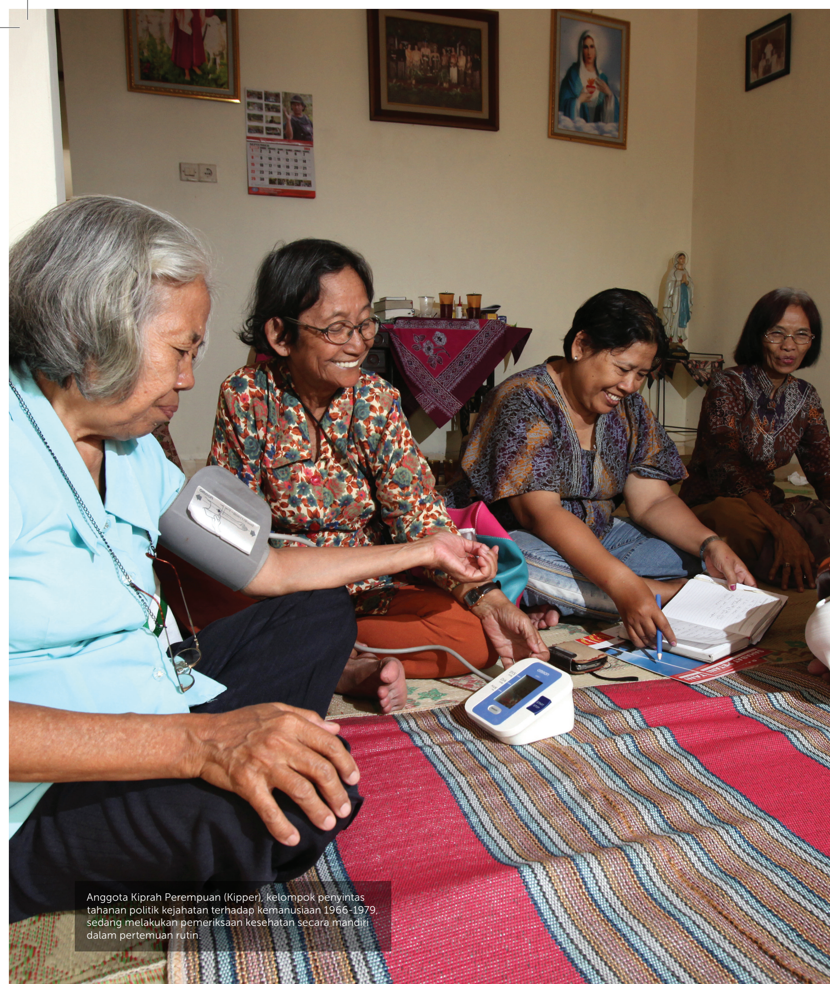
Anggota Kiprah Perempuan (Kipper), kelompok penyintas tahanan politik kejahatan terhadap kemanusiaan 1966-1979, sedang melakukan pemeriksaan kesehatan secara mandiri dalam pertemuan rutin.