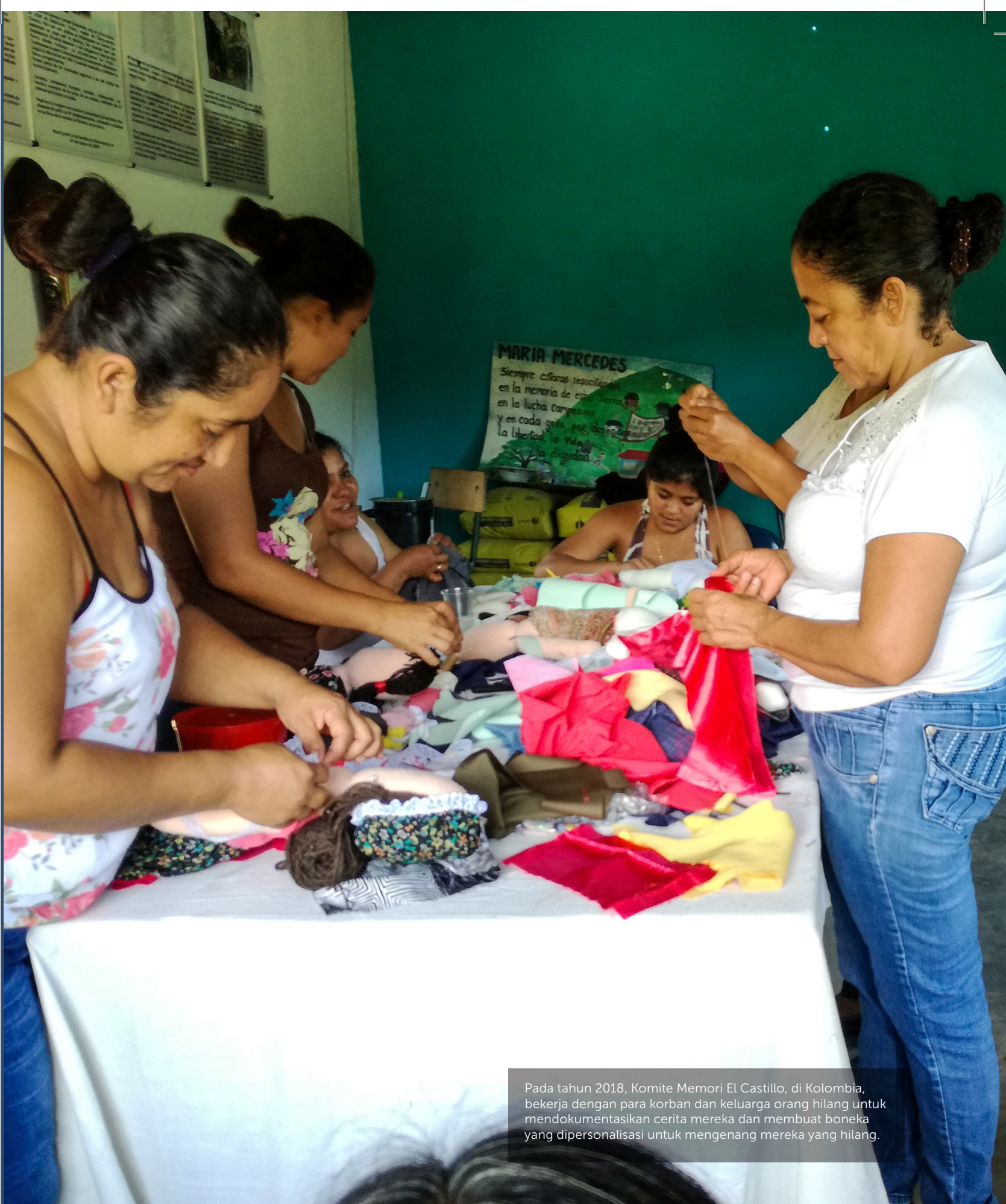
Pada tahun 2018, Komite Memori El Castillo, di Kolombia, bekerja dengan para korban dan keluarga orang hilang untuk mendokumentasikan cerita mereka dan membuat boneka yang dipersonalisasi untuk mengenang mereka yang hilang.