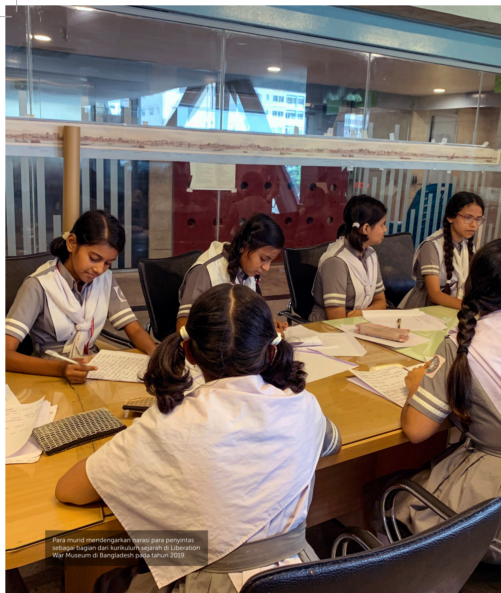
Para murid mendengarkan narasi para penyintas sebagai bagian dari kurikulum sejarah di Liberation War Museum di Bangladesh pada tahun 2019.